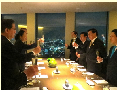
ラオス首相歓迎夕食会