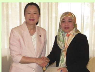
ブルネイ・マレーシアにて 要人訪問と現地調査