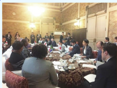
南アフリカ下院科学技術委員会 との意見交換会