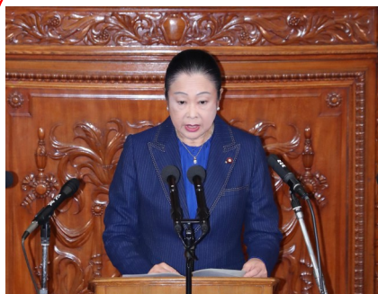
消費者問題に関する 特別委員長への就任！