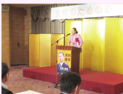
山口県にて「女性のための 政治セミナー」で講演