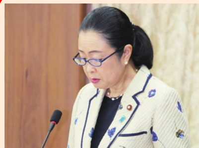
衆議院国土交通委員会にて 政府に質問