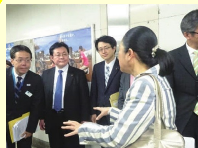
都内地下鉄における バリアフリー対策等の視察