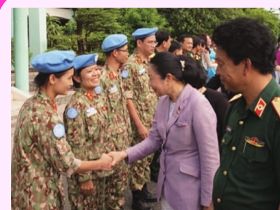
自由民主党女性局海外研修の 訪問団長としてベトナムを訪問