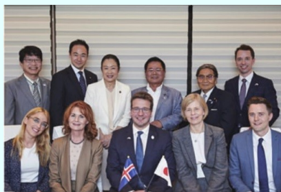
アイスランド外務大臣との 意見交換