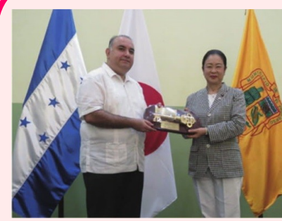
中・南米諸国を歴訪し 要人訪問と現地調査