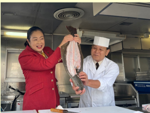
11. 23 発見！ふくしまお魚まつり