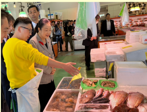
10. 11 小名浜魚市場視察

復興大臣に就任してから、東日本大震災で被災した地域をたくさん訪れました。視察先や復興の現場の状況をしっかりと受け止めて、引き続きいろいろな所をできる限りお邪魔して、今の状況を把握して、一日も早い被災地の復興・再生に向けて全力で取り組んでいきたいと思っています。