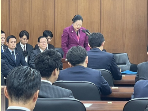
11. 4 衆議院復興特別委員会にて所信表明

私は初当選以来無派閥の立場にあり、今回の過少記載の問題も青天の霹靂でしたが、国民の皆さまの政治への不信感は高まっていると感じております。だからこそ今の大臣としての職務を全うし、その内容について丁寧に説明していかなければならないと思っております。