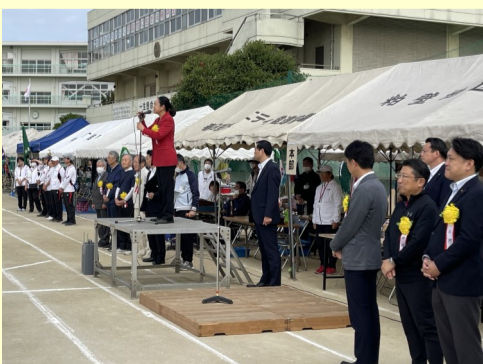
10. 8 春日部市内の地区運動会

復興大臣就任以来、16区の皆さまにお目にかかる機会が減ってしまいましたが、お祭りや体育祭などのイベントを中心に参加しています。皆さまの笑顔で私も元気になります。これからも16区の発展に尽力してまいりますので、引き続き応援よろしくお願いいたします。