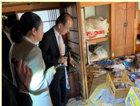
10. 12 大熊町帰還困難区域視察