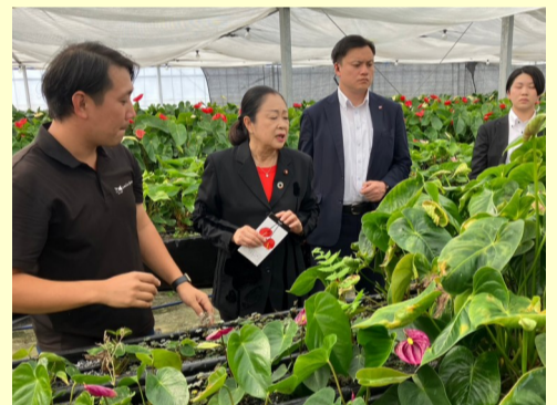
10. 19 川俣町 観光農園