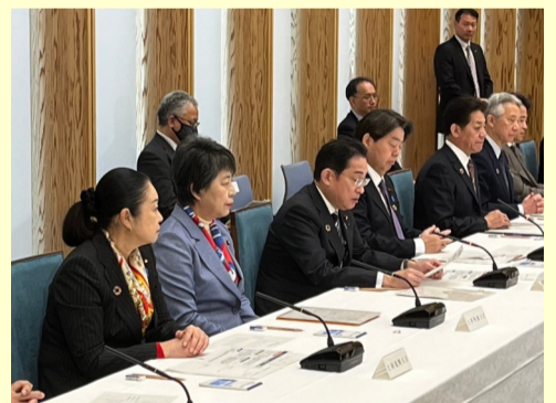
12. 19 SDGs推進本部会合