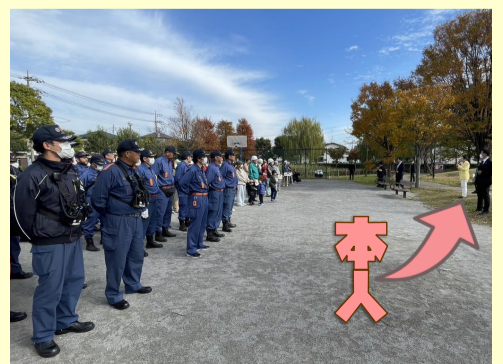
11. 23 吉川市中野地区防災訓練にて