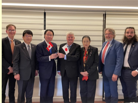
11. 17 加日議連の共同議長の歓迎懇談会