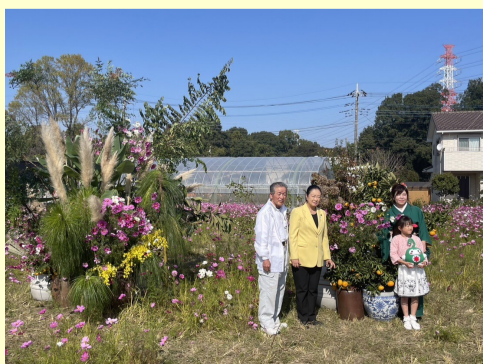
11. 3 岩槻区の鹿室コスモスまつり