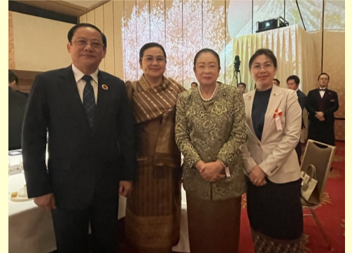
12. 17 ASEANガラパーティーにて ラオスのソンサイ首相と