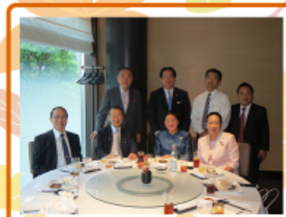
2015年8月28日 ザ・キャピトルホテル東急 日本ラオス友好議員連盟主催でパニーニ議長訪日歓迎昼食会を行いました。