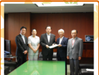
2015年8月3日 国土交通省&自民党本部 東埼玉道路建設促進期成同盟会に同行し、国土交通省大臣や自民党本部に要望活動しました。