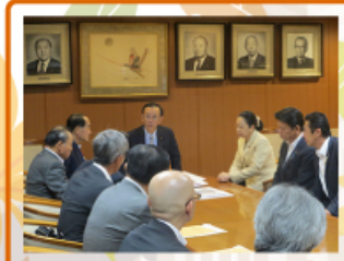
2015年7月1日 国土交通省&自民党本部 中川・袴川流域改修促進期成同盟会に同行し、国土交通省や党幹事長に要望活動しました。