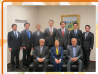
2015年3月3日 衆議院外務委員長室 イラン・イスラム共和国国会外交安全保障委員と衆議院外務委員会理事で意見交換会を行いました。