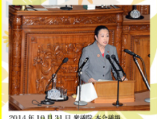
2014年10月31日 衆議院 本会議場 衆議院本会議にて「日豪経済連携協定」を外務委員長として、報告しました。