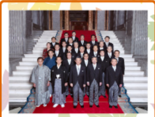
2015年1月26日 国会(衆議院) 国会開会式が天皇陛下ご列席のもと開かれました。再度、衆議院外務委員長に就任致しました。