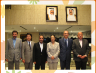
2015年9月9日 クウェート国大使館 クウェート国 アブドゥルラフマーン・アルオタイビ駐日大使より夕食会のご招待を頂きました。