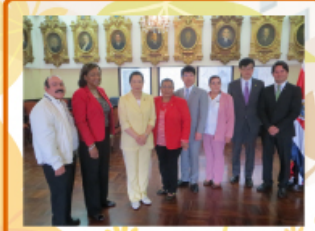
2015年4月29日～5月3日 コスタリカ・エルサルバドル・パリーズの中米を視察しました。