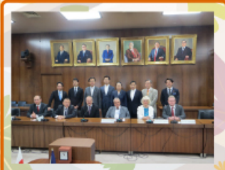
2015年6月2日 衆議院委員会 チェコ共和国下院外交委員会一行と衆議院外務委員会懇談会を行いました。