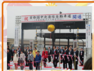
2015年3月29日 久喜JCT～坂古河IC (圏央道) 圏央道(久喜JCT～坂古河IC)開通式に出席しました。今年10月末には、念願の埼玉全線開通。