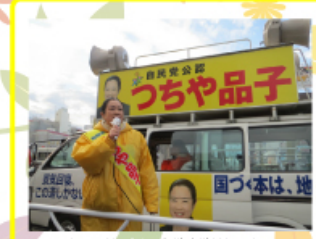
2014年12月14日 衆議院議員総選挙 第47回衆議院総選挙において6回目の当選を9万票を超える得票で果たすことができました。