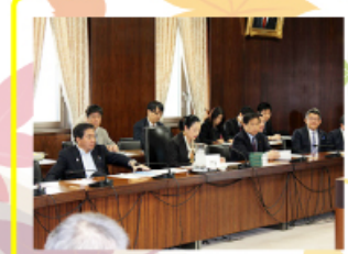
2014年10月29日 外務委員会 委員長として、我が国を取りきく重要な外交課題が山積する中、立法院の立場から全力を尽くします。