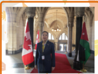
2015年4月28日～29日 カナダ 日本カナダ友好議員連盟として、カナダで行われました春同年次総会に出席しました。