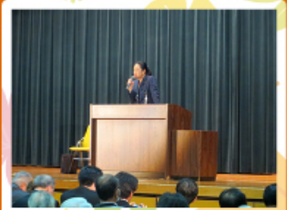
2015年7月4日 アナタス春日部 今後の外交・安全保障問題について、時局講演会を地元の春日部で行いました。