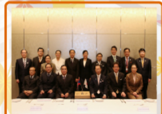
2015年3月6日 ザ・キャピトルホテル東急 日本ラオス友好議員連盟としてラオスのトンシン首相来日歓迎夕食懇談会を行いました。