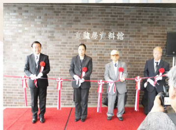
2014年4月30日 重監房資料館（群馬県草津町） 国立ハンセン病療養所・栗生泉園内に建設を進めてきた資料館の開館記念式典に出席しました。