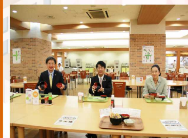
2013年11月25日 厚生労働省内職員食堂 「とっても、美味しい」。「三省（厚生労働省・経済産業省・農林水産省）共同復興支援、水産物を食べて応援」メニューを完食。