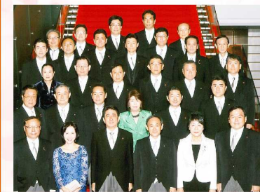
2013年9月30日 首相官邸 厚生労働副大臣に就任しました。医療・介護・子育て支援を中心に取り組むこととなりました。