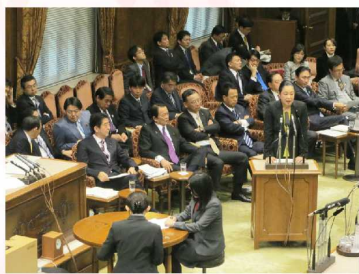
2014年2月5日 国会議事堂 参議院予算委員会で、厚生労働行政に対する質問に対して答弁しました。