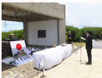
2014年7月9日 硫黄島 島内を視察し、硫黄島戦没者の碑にて追悼式に出席しました。