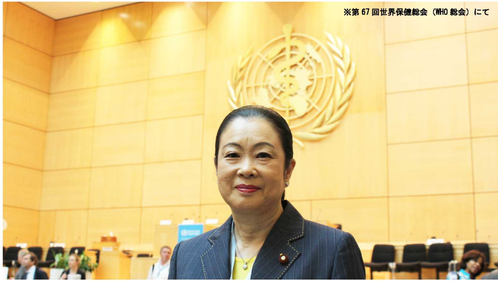
※第67回世界保健総会（WHO 総会）にて