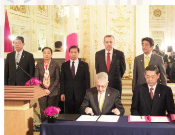
2014年1月7日 迎賓館 赤坂離宮 日・トルコ首脳会談時に、両首相会いのもと、医療・保健分野の協力覚書を交換しました。