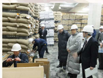
2014年1月20日 横浜検疫所 検疫所の業務内容について視察してきました。「輸入された落花生」のサンプリング状況について説明を受けました。