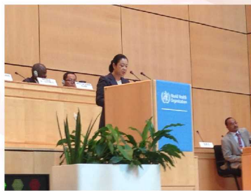
2014年5月19日 国際連合欧州本部（ミラノ） 第67回世界保健総会（WHO総会）が開催され、政府代表として出席しました。