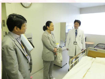
2014年8月28日 栄養研・感染研・医療研究センター（新宿区） 感染症の予防、治療方法の研究の状況を把握するため視察しました。エボラ出血熱等の流行状況や対応について説明を受けました。