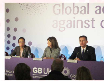
2013年12月11日 ランカスターハウス（ロンドン） 認知症をテーマにしたG8初の会合である「G8認知症サミット」が開催され、出席しました。