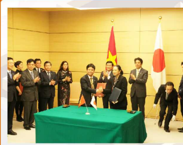
2014年3月18日 首相官邸 厚生労働省とベトナム社会主義共和国保健省の医療・保健分野に関する協力覚書の署名式に出席しました。